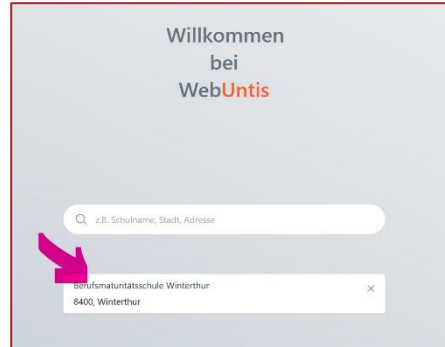
Abb. 3: Wahl der Schule