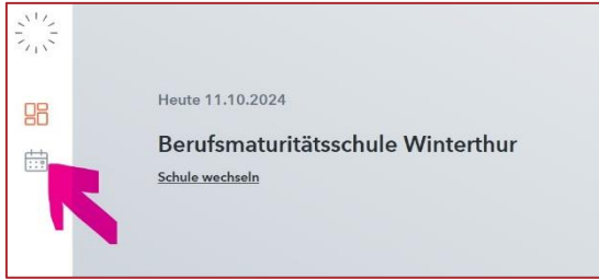
Abb. 4: öffentlicher Stundenplan